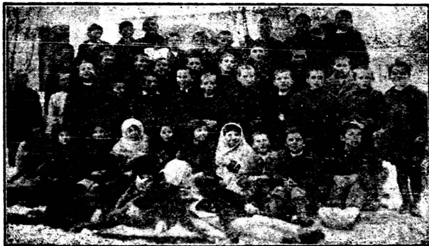
Consiliul de Administrație al Cooperativei școlare din Luncavița și cititorii revistei.