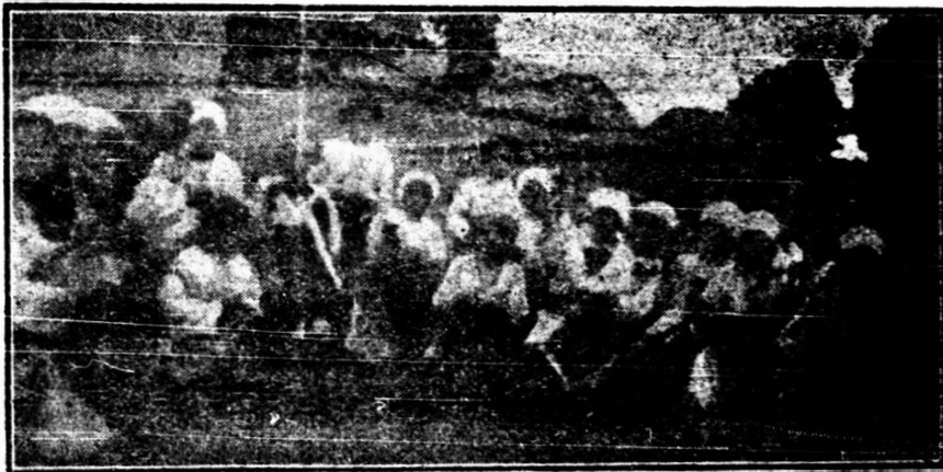
O șezătoare școlară la școala din Caraibil.